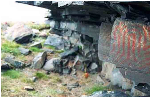
■ Красочные изображения на полуострове Рыбачий, Россия

деть петроглифы, выполненные на валунах насыпей могильников эпохи неолита и бронзового века. Больше всего рисунков, выполненных краской, найдено в южной и центральной Финляндии, в южной Швеции и в одном месте северо-запада России — на полуострове Рыбачий на Баренцевом море. В Норвегии красочные изображения встречаются в основном в гротах и пещерах, причем среди них доминируют человеческие фигуры. Считают, что пещерные изображения связаны с обрядами. В Швеции и Финляндии изображения, нанесенные краской, встречаются только на открытых скалах. Они, как и петроглифы, могут быть интерпретированы как часть ритуалов, связанных с охотой, духами и шаманизмом.