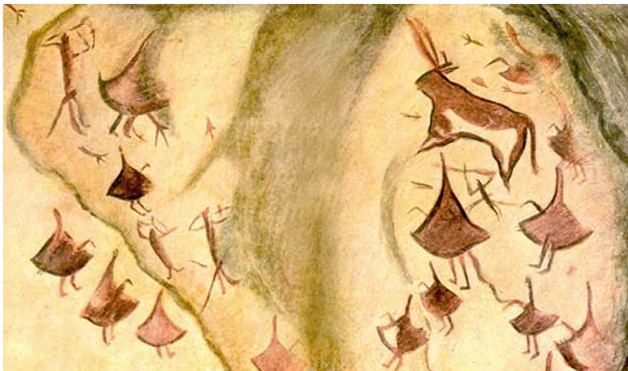
■ Сцена охоты, Зараут-Камар

В 1987 году на территории, где располагается памятник, был образован Государственный заповедник «Сурхон». В настоящее время ведутся работы по консервации наскальных рисунков Зараут-Сая и сохранению их как национальной культурной ценности. В 2008 году рисунки гротов Зараут-Камар были включены в Список всемирного наследия ЮНЕСКО.