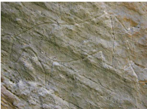
■ Гравированные изображения на скалах Кобустана

древних викингов прибыли в Скандинавию на лодках с берегов Каспия.