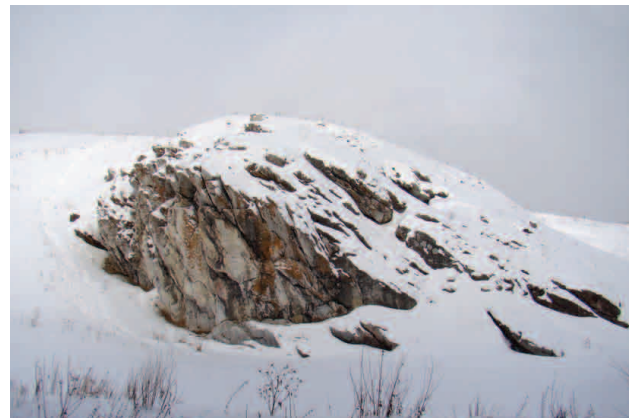
■ Общий вид Писаного камня, 2010 год

После смерти Витсена работа над выпуском в свет «Татарии» почти на 70 лет прекратилась. Лишь в 1785 году она была опубликована в Амстердаме.