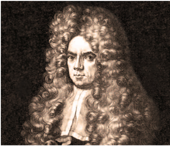
Николай-Корнелий Витсен (1641 -1717)

Известный государственный деятель Нидерландов, учёный, юрист, путешественник, бургомистр Амстердама с 1682 по 1706 годы.