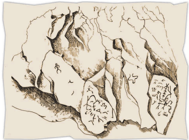
■ Рисунки Писаного камня и его изображений, выполненные Иоганном Люрсениусом

не произошло серьезных видимых изменений. Краска и поверхность скалы оказались достаточно стойкими против атмосферных воздействий.