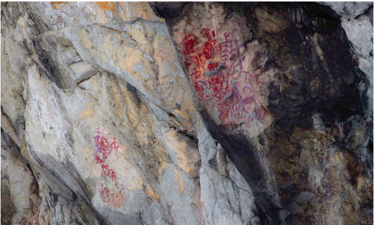
■ На представленной фотографии, сделанной И. Хамзиным в марте 2010 года, видны три панели с древними изображениями. Цвет рисунков усилен с помощью компьютерной обработки, кроме того на снимке удалены современные граффити. Различные оттенки красного могут свидетельствовать о разновременности создания фигур писаницы, либо о повторной подкраске некоторых ее фрагментов.

Поверхность скалы во многих местах покрыта современными сколами, надписями и рисунками. Ирбитский Писаный камень является ценнейшим историческим памятником, он лег в основу изучения наскальных изображений на территории Урала и всей России.