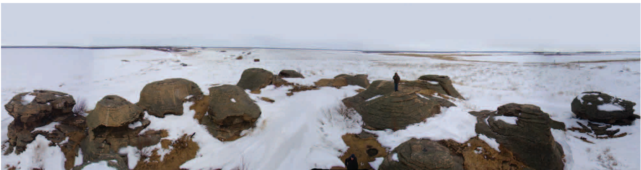
■ Панорама Больших Каменных Палаток на озере Большие Аллаки. Древние рисунки сохранились на крайних левом и правом останцах, 2010 год