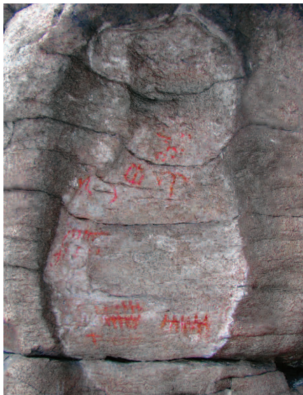
■ Вторая группа Большеаллакской писаницы, 2010 год

После компьютерной обработки изображений первой и второй групп, нам удалось найти ряд новых фигур, а также уточнить некоторые фрагменты описанные исследователями ранее. Интересно, что на снимках, полученных нами в 2010 году, проявились фигуры, видимые на прорисованных фотографиях В.Я. Толмачева и отсутствовавшие на зарисовках 1960–1990-х годов.