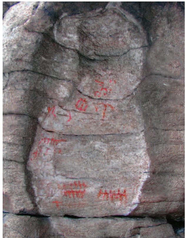
■ Вторая группа Большеаллакской писаницы, 2010 год