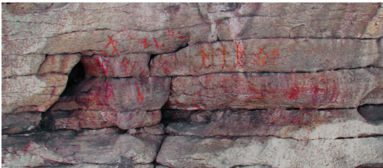
■ Первая группа Большеаллакской писаницы, 2010 год