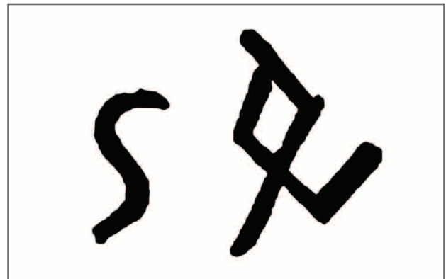
■ Фигуры на Малых Каменных Палатках по зарисовке В.Я. Толмачева, 1914 год

Таким образом, в начале XX века на Больших Аллаках были зафиксированы две группы скальных выходов с древними изображениями, расположенные на разных берегах озера.