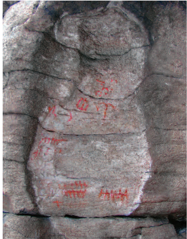
■ Вторая группа Большеаллакской писаницы, 2010 год

После компьютерной обработки изображений первой и второй групп, нам удалось найти ряд новых фигур, а также уточнить некоторые фрагменты описанные исследователями ранее. Интересно, что на снимках, полученных нами в 2010 году, проявились фигуры, видимые на прорисованных фотографиях В.Я. Толмачева и отсутствовавшие на зарисовках 1960–1990-х годов.