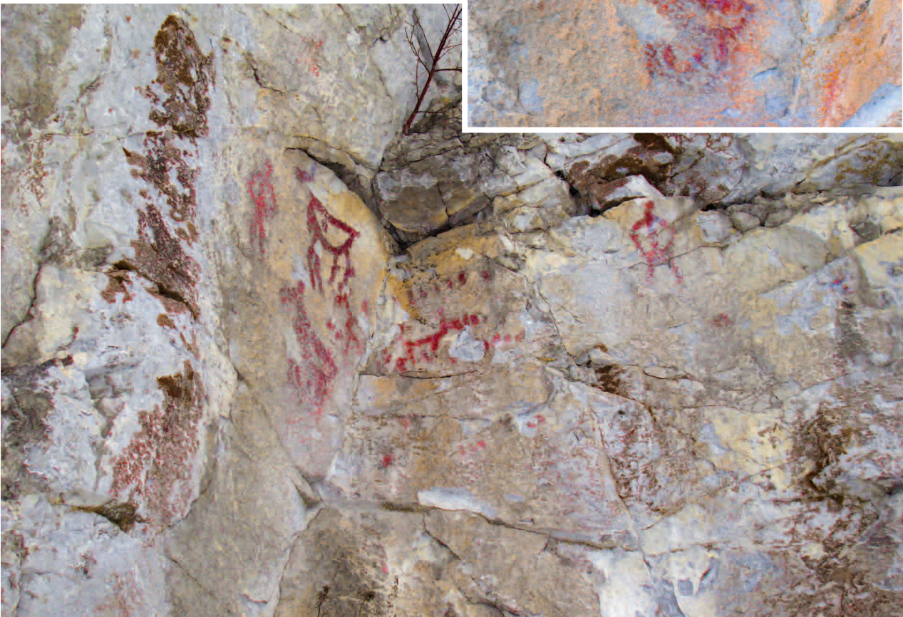
■ Две группы рисунков Сергинской писаницы после компьютерной обработки. Сегодня этот памятник наскального искусства находится под охраной егерской службы природного парка «Оленьи ручьи». В прежние годы панели с изображениями были выбраны охотниками в качестве мишеней, о чем свидетельствуют многочисленные сколы на скальной поверхности