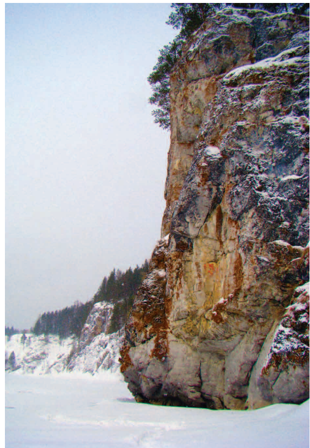
■ Общий вид Сергинского Писаного камня, 2010 год

Левое панно по В.Н. Широкову содержит одну фертообразную фигуру человека, справа от нее две фигуры копытных, выполненных в рентгеновском стиле, и две полусотовые формы. Чернецов видел в изображениях животных косуль, а полусотовые мотивы расшифровывал как еще одну или две фигуры копытных усеянных сколами.