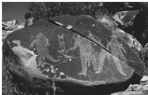
■ Большой валун с петроглифами был расколот ударом молнии, комплекс Спир Хилл, Северо-Западная Австралия