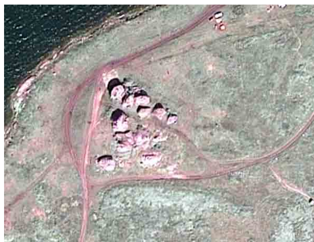
■ На спутниковом фото хорошо видны колеи, накатанные прямо между останцев с рисунками. Каменные палатки на оз. Большие Аллаки

фии древних изображений можно найти в отчетах на интернет-форумах, посвященных покорению бездорожья.