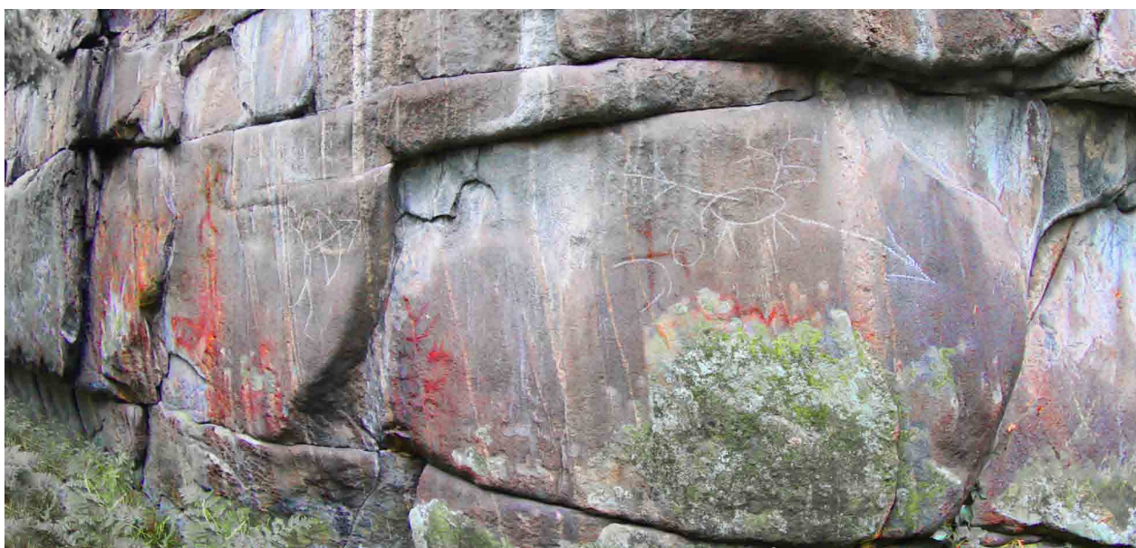
■ Современные рисунки на Шайтан Камне

Тем не менее, нельзя считать практику сдачи в аренду местными администрациями прибрежные земель неприемлемой. Существуют многочисленные положительные примеры подобной практики. Однако необходимо оговаривать реальную ответственность, которую должен нести предприниматель, за состояние вверенной ему территории, особенно если на ней расположен природный или исторический памятник.