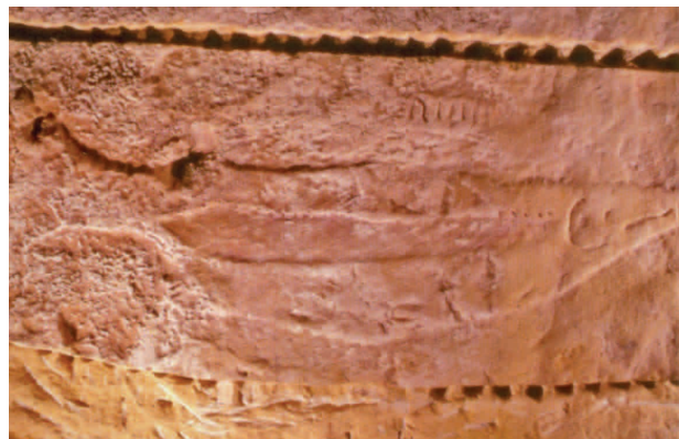
■ Изображение рыбы из Абри дю Пуассон, Дордонь, Франция

Сама природа неумолимо разрушает древние полотна. Землетрясения, камнепады, дождь, ветер, перепады температур наносят им непоправимый урон. Свою лепту в это процесс вносят растения, лишайники, грибки и различные микроорганизмы. Особую опасность представляют лесные пожары. Сильный перегрев каменной поверхности приводит к ее растрескиванию, отслаиванию и разрушению наскальных изображений. Кроме того, пепел и древесный уголь от пожаров может загрязнить органический материал, используемый для датирования.