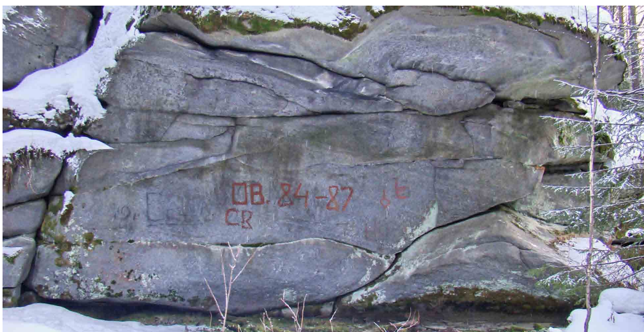
■ Скала с писаницей на мысе Еловом