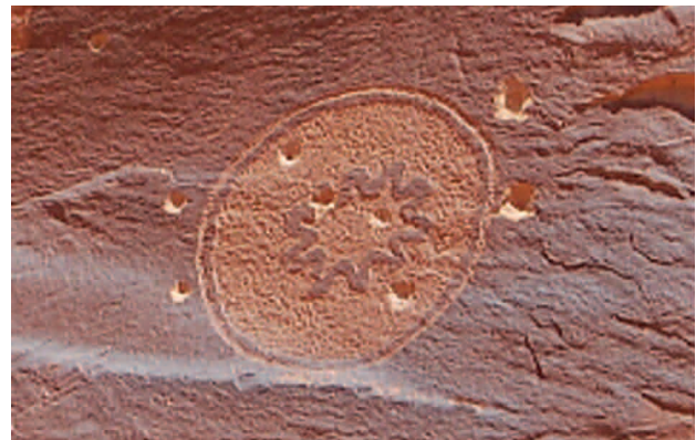
■ Панель с петроглифами, поврежденная выстрелами, район Батлер Вош, Юта, США

Подобным образом были повреждены некоторые уральские писаницы. Уральский гранит более тверд, но все же дробь и пули скололи кальцитовые натечки, на которые нанесены рисунки. От подобные действий человека, пострадали, например, Ирбитский и Сергинский Писаные камни, Шайтанская писаница.