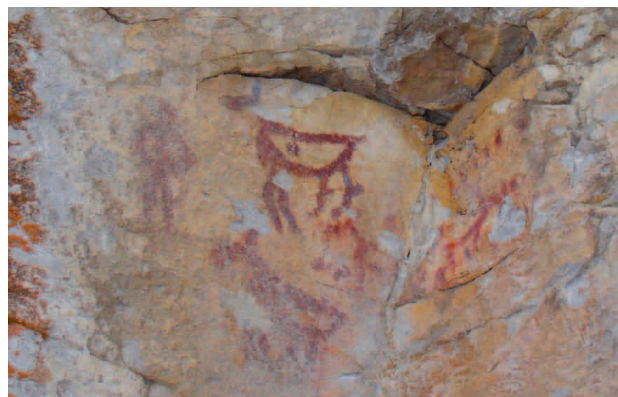
■ Следы от выстрелов на Сергинском Писаном камне

Так, например, режевской Шайтан Камень, часто посещается участниками трофи-рейдов, фотогра-